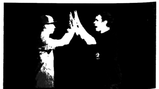
Erarbeitung 4 (Handshake) 1/2