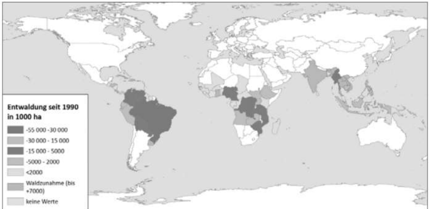
Abb. 3: Absoluter Rückgang des tropischen Regenwaldes von 1990–2015

Bearbeite nun nachfolgende Aufgaben (Du musst sie nicht zuschicken). Die Lösungen werden hierzu wieder hochgeladen. Die nachfolgende Karte zeigt den absoluten Rückgang des tropischen Regenwaldes von 1990 bis 2015.